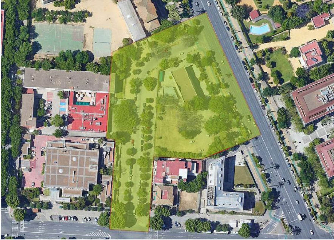
Ámbito de ordenación del entorno de la parcela

Se establecen dos áreas de alcance de la intervención. La primera tiene que ver con la necesidad de ordenación urbana del entorno de la parcela principal, y afecta especialmente la calle Isaac Peral. En ella se deberá reordenar la calle y la relación con las parcelas a las que da acceso. Esta intervención debe tener en cuenta el carácter unitario que la manzana tuvo, antes de la apertura de la calle Isaac Peral.