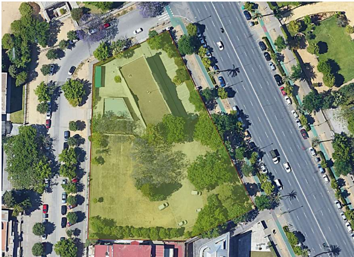
Ámbito de localización de la edificación.

La parcela en la que se debe edificar coincide con la definida actualmente en la normativa urbanística. Comprende la totalidad de esta, incluyendo el pabellón existente actualmente. Dicho pabellón quedará integrado en la propuesta de ordenación de la parcela, aunque no se realice ninguna intervención sobre él. Igualmente mantendrá el uso actual de edificio administrativo del Ayuntamiento. Si se podrá demoler el almacén aledaño construido en el frente de la calle Isaac Peral. Además de la ordenación del entorno y de la propia parcela, se deberá respetar la vegetación existente.