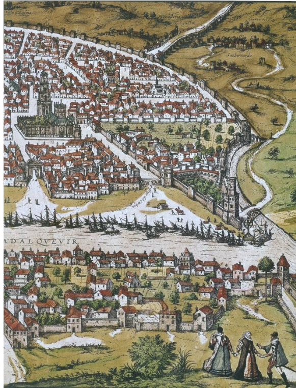
Vista de Sevilla (detalle). Joris Hoefnagel, 1588