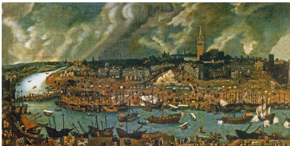
Vista de Sevilla desde Triana, atribuida a Sánchez Coello, c. XVI

El futuro Distrito Urbano Portuario de Sevilla constituye una oportunidad histórica para la ciudad de reconsiderar por completo su relación con el río, recuperando la margen fluvial como soporte de actividades urbanas complejas y superpuestas. Las representaciones históricas de Sevilla como una ciudad que sólo se entiende desde su relación con el río, y que desde su ribera construye su identidad vienen a la memoria al hilo del nuevo Masterplan .