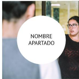
12 febrero | Plazo de entrega Escuela de arquitectura