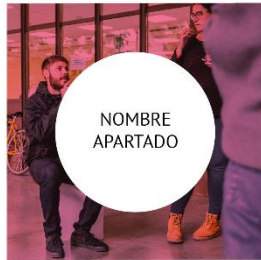
12 febrero | Plazo de entrega Escuela de arquitectura