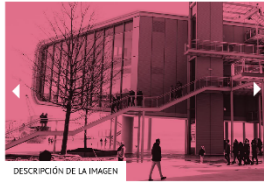
DESCRIPCIÓN DE LA IMAGEN